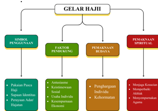
Gambar 1. Skema Analisis Gelar Haji

Masyarakat umumnya menghormati haji yang menunjukkan konsistensi dalam ibadah dan sikap hidup yang sesuai ajaran. Jumlah jemaah haji yang terus meningkat mencerminkan dua hal utama yaitu, meningkatnya kesadaran religius dalam menunaikan rukun Islam kelima, serta membaiknya kondisi ekonomi karena biaya haji tergolong tinggi (Nirwanti, Has, & Ikhsan, 2021).